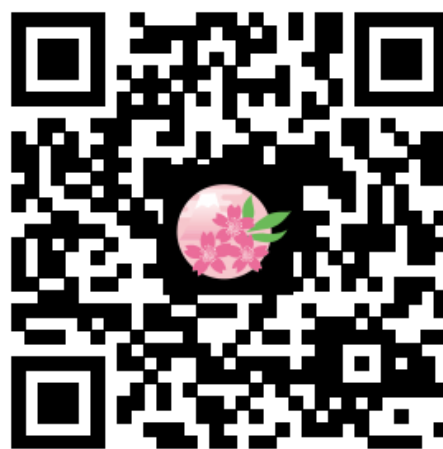
本馆腾讯微博二维码