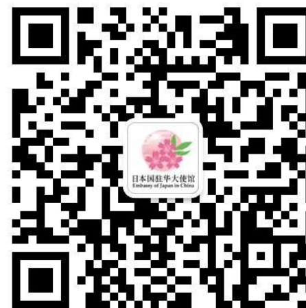
本馆官方微信二维码