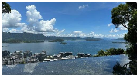
参访交流：香港中文大学