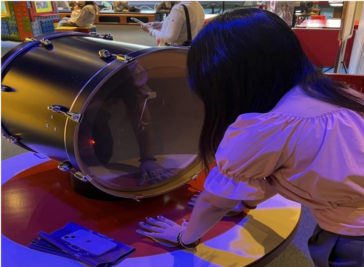
(Hong Kong Science Museum )

direct speaking country, but in fact, it was not, especially Israel.