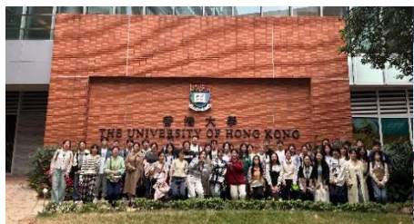
参访交流：香港大学