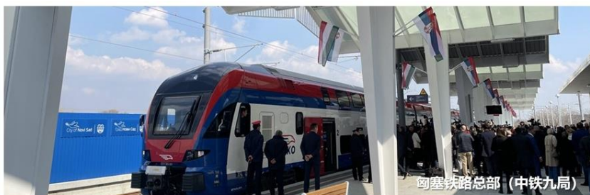
匈塞铁路总部（中铁九局）