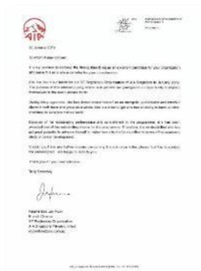
实习学员推荐证明信